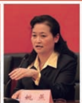
中国建筑材料集团公司总经理 姚辉