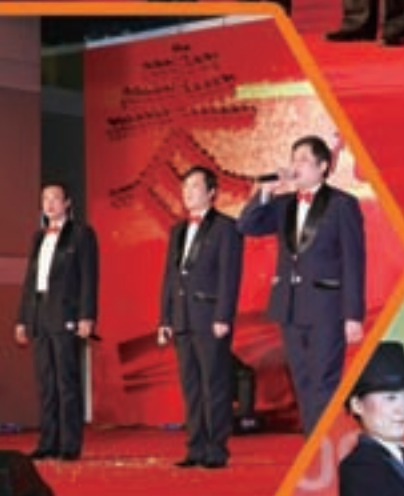
中国建材集团领导 向来宾及全体员工拜年