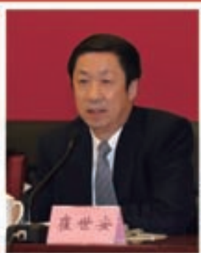
国有重点企业监事会主席 崔世安