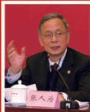
中国建筑材料联合会会长 张人为