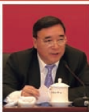
中国建筑材料集团公司董事长 宋志平