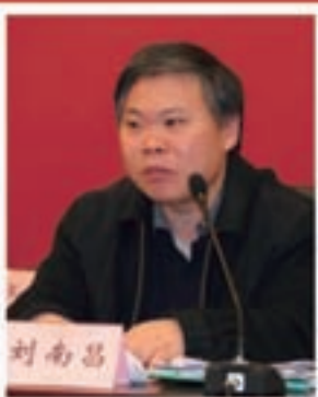
国资委业绩考核局副局长 刘南昌