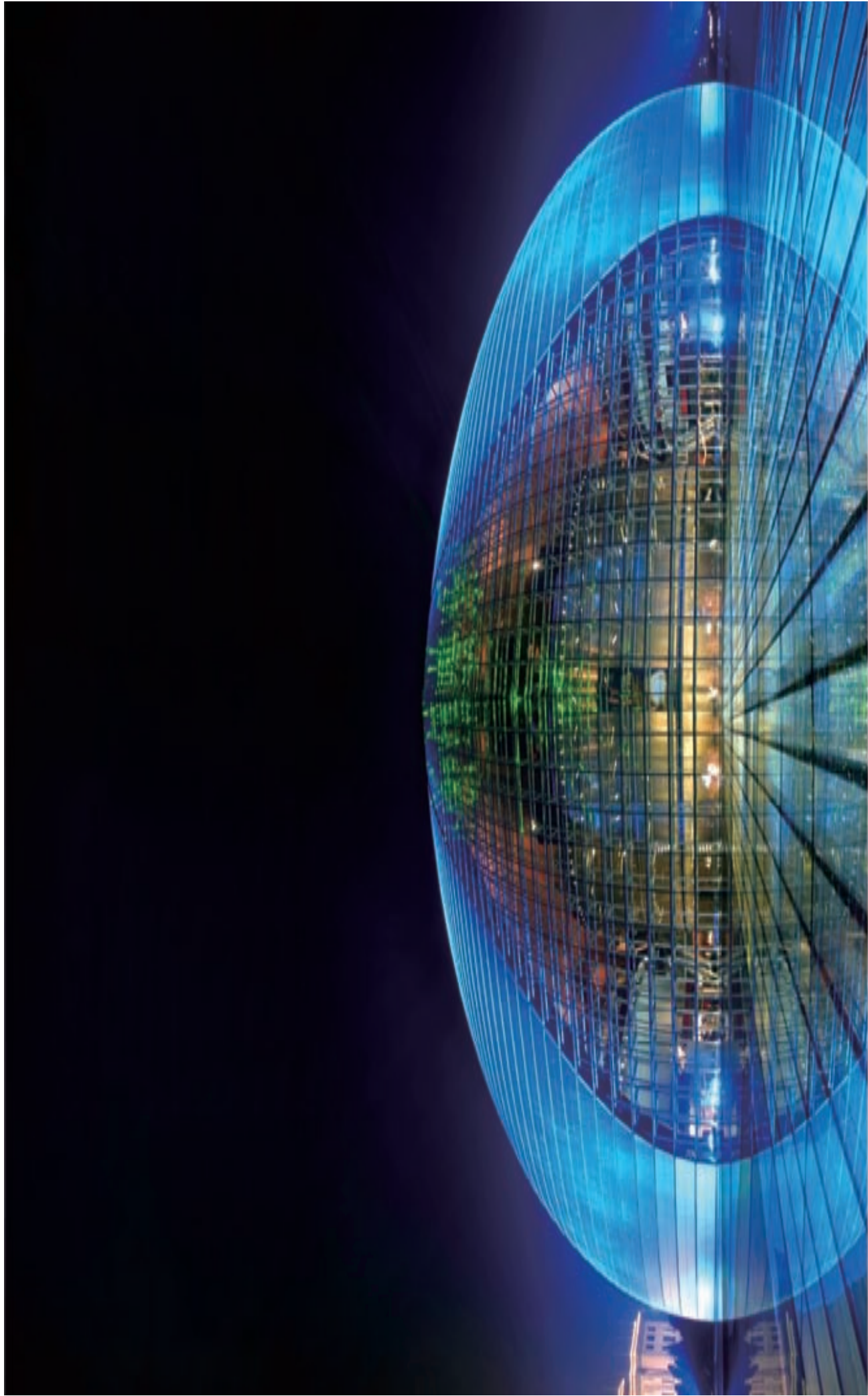
中国大剧院